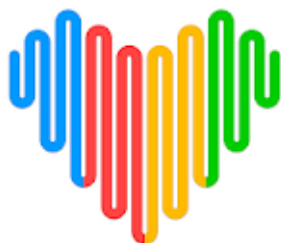
Application Wearfit Pro